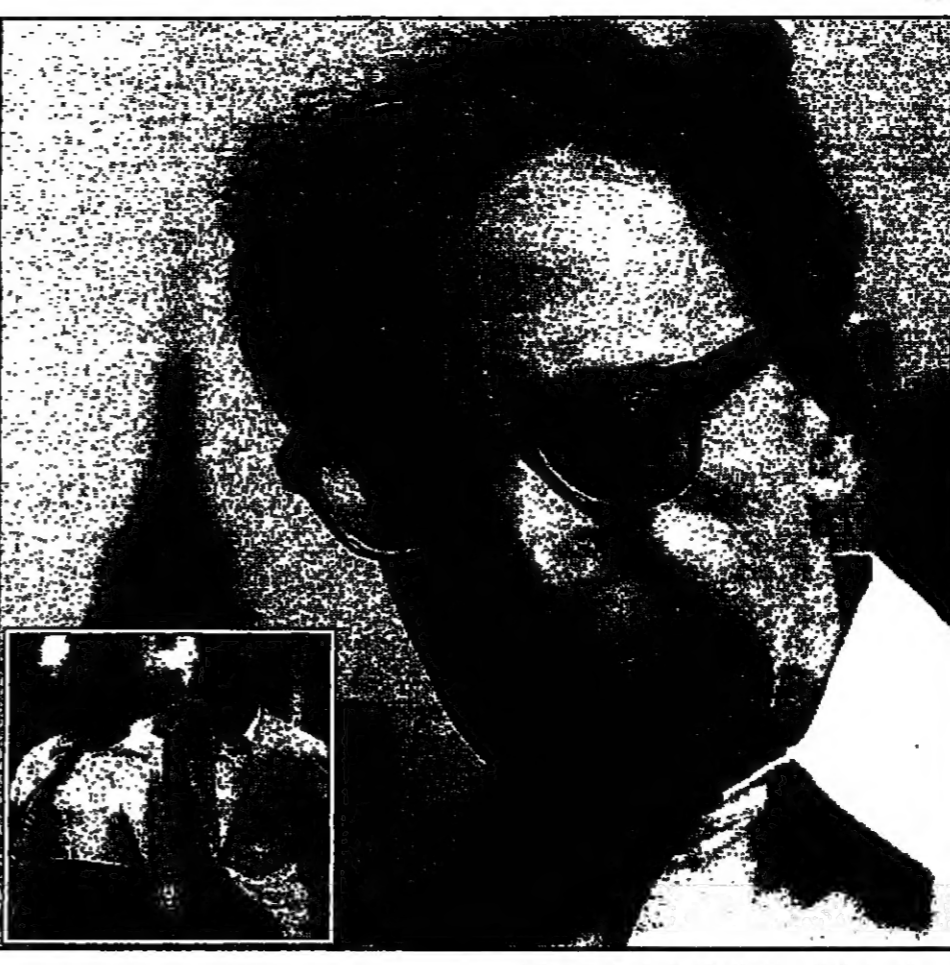
باريس.. القديس العربي